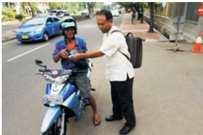
Mengamati keseharian salah satu calon pimpinan KPK, yang memakai jasa ojek ketika ke kantor

Seperti periode-periode sebelumnya persoalan yang membelit proses pemilihan pimpinan KPK periode 2011-2014 adalah banyaknya kepentingan yang mencampuri. Rivalitas institusi penegak hukum dan intervensi oleh politisi adalah persoalan yang paling dominan.